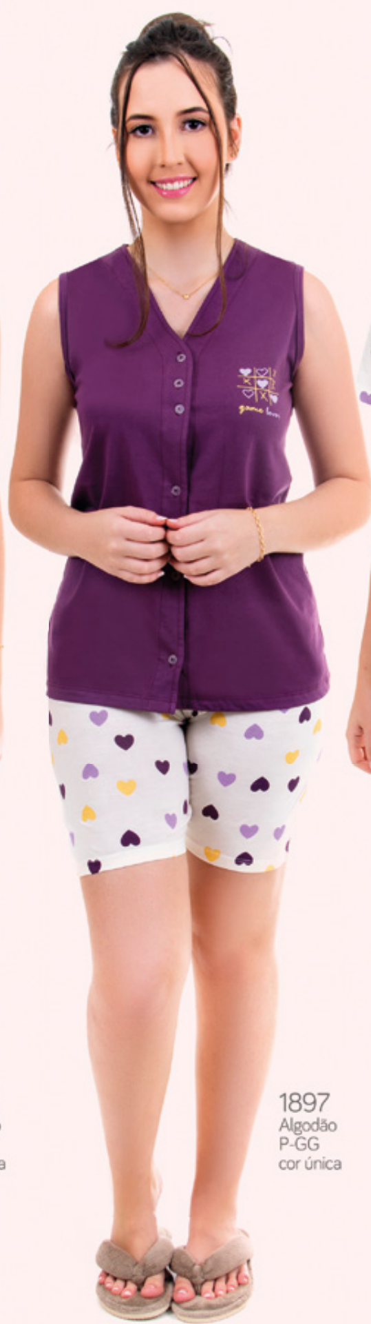
1897 Algodão P-GG cor única