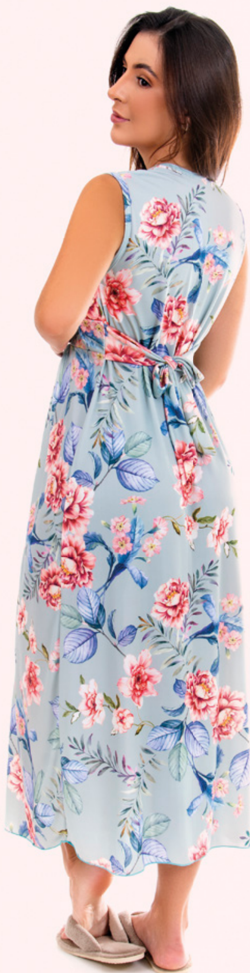
1914 Poliamida P-EG cor única