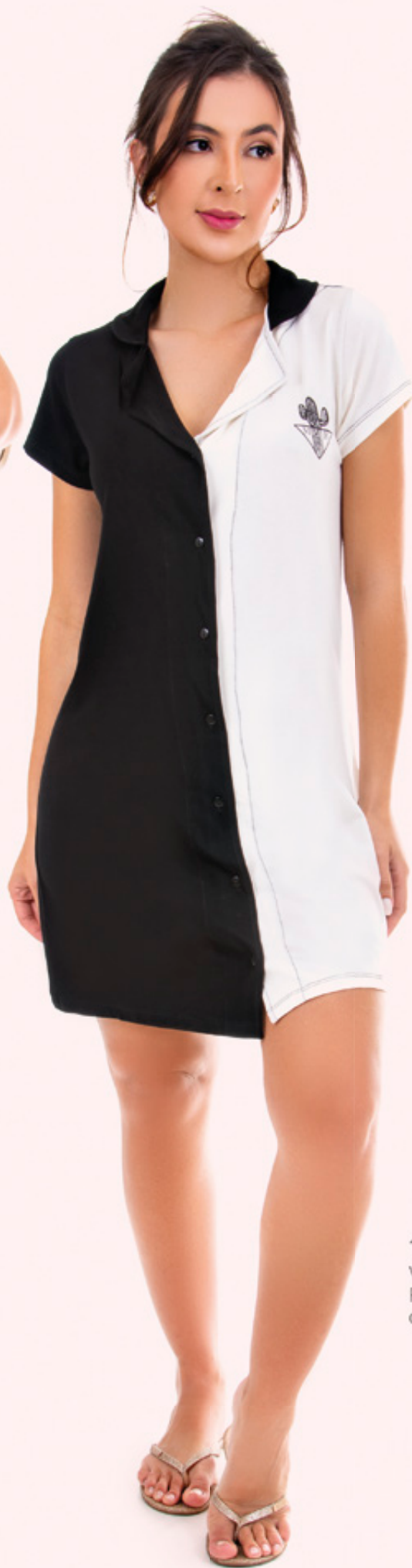
1851 Viscolycra P-EG cor única