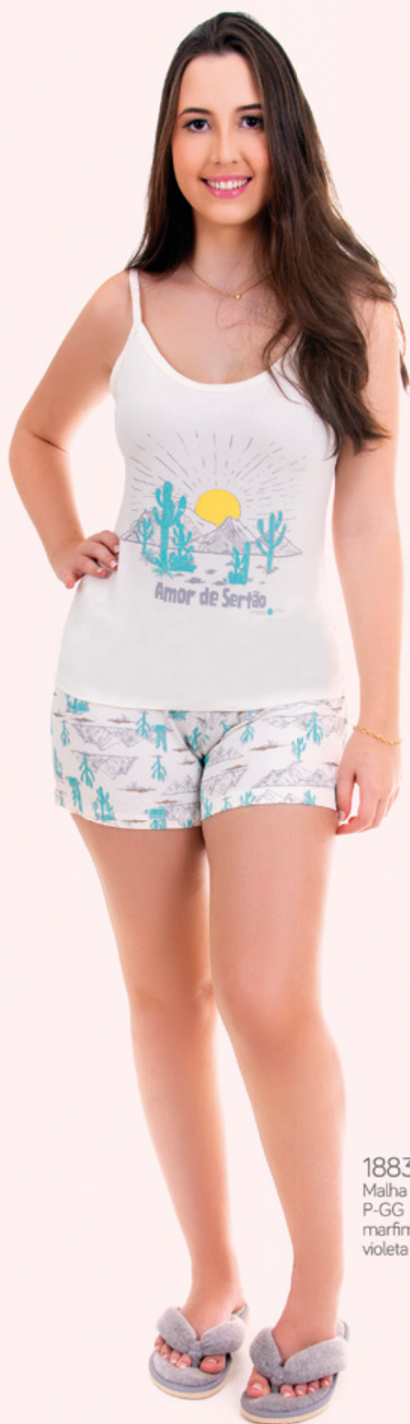
1883 Malha PV P-GG marfim violeta