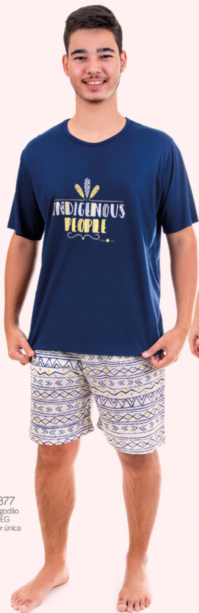
1877 Algodão P-EG cor única