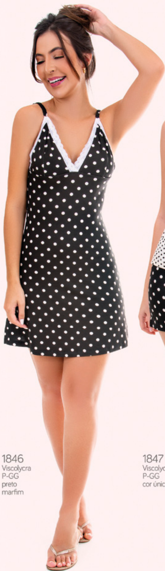
1846 Viscolycra P-GG preto marfim