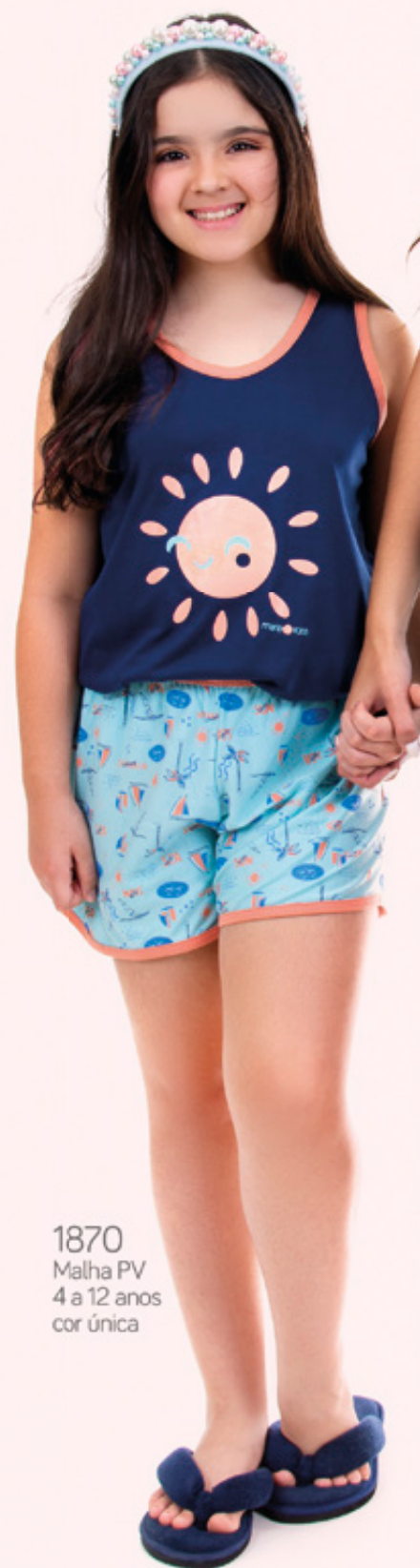
1870 Malha PV 4 a 12 anos cor única