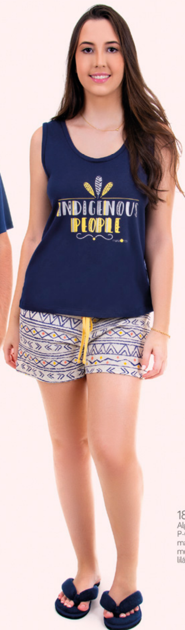
1876 Algodão P-GG marinho mescla lilás