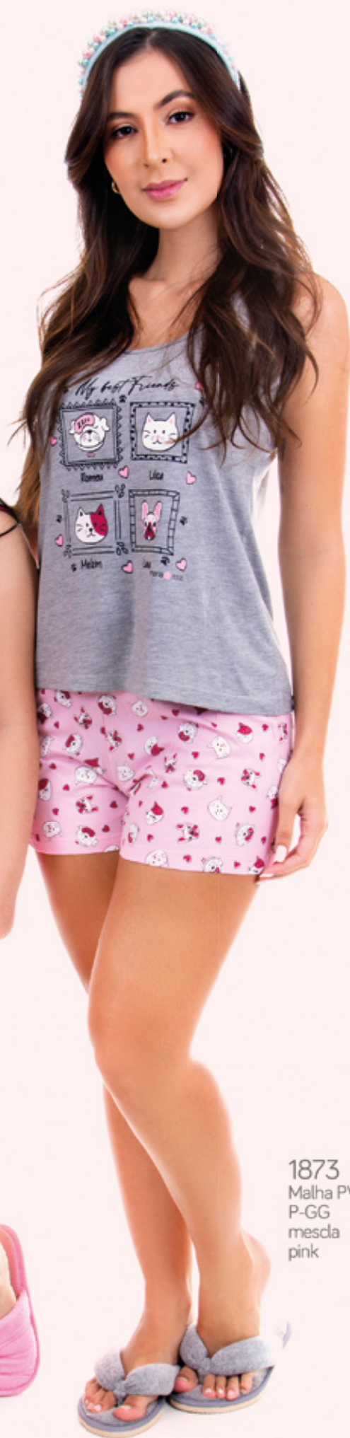
1873 Malha PV P-GG mescla pink