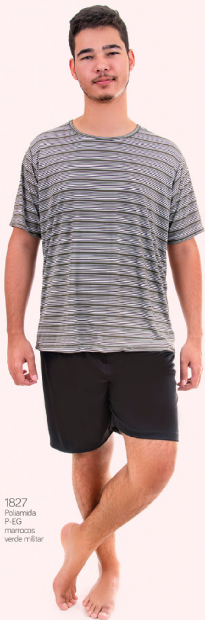
1827 Poliamida P-EG marrocos verde militar