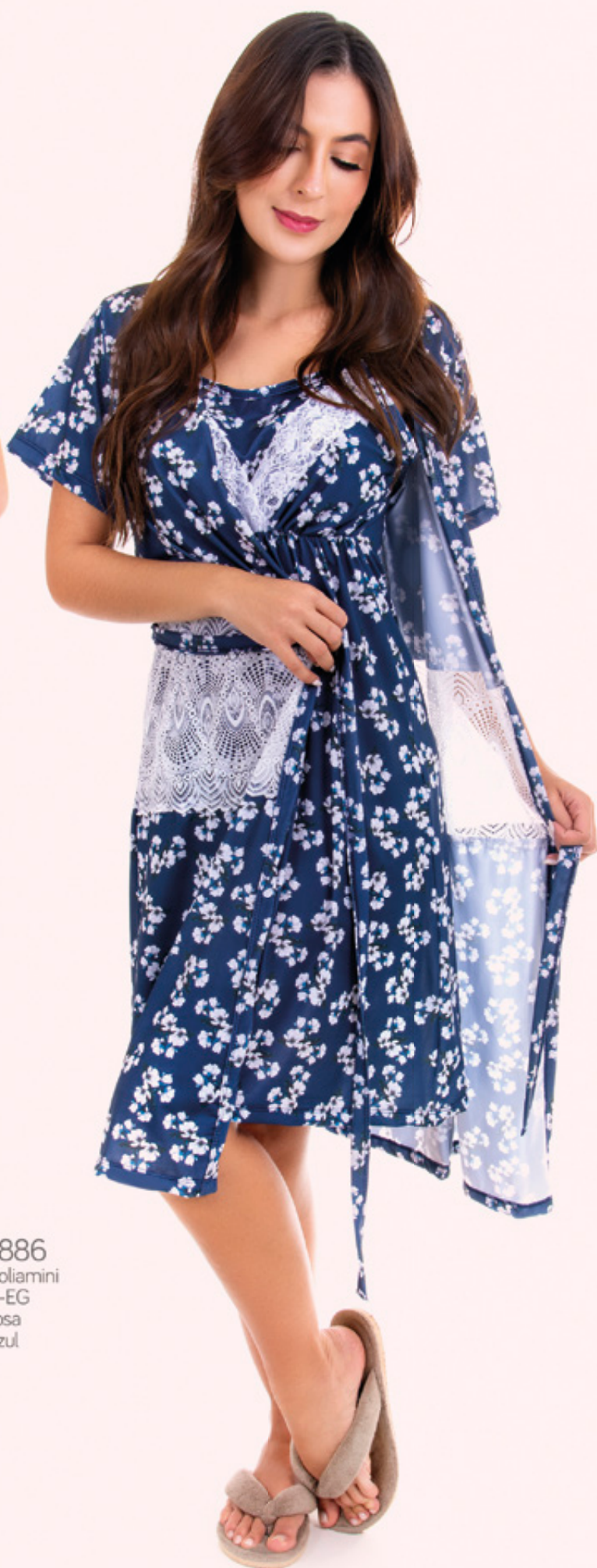
1886 Poliamini P-EG rosa azul