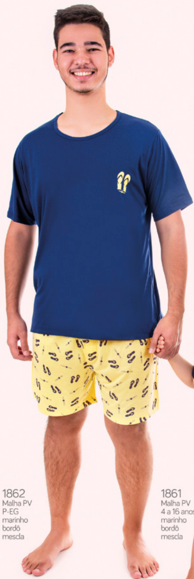
1862 Malha PV P-EG marinho bordô mescla