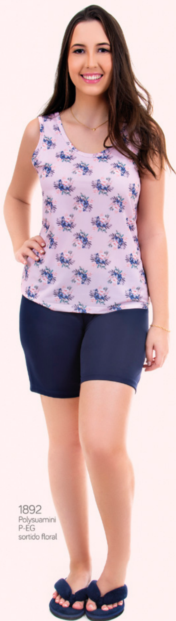
1892 Polysuamini P-EG sortido floral