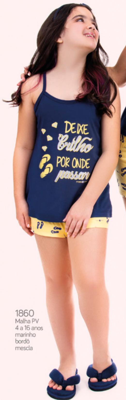
1860 Malha PV 4 a 16 anos marinho bordô mescla