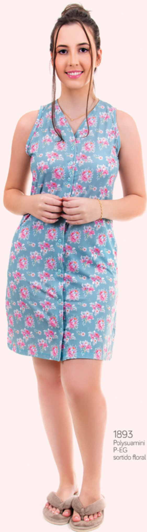
1893 Polysuamini P-EG sortido floral