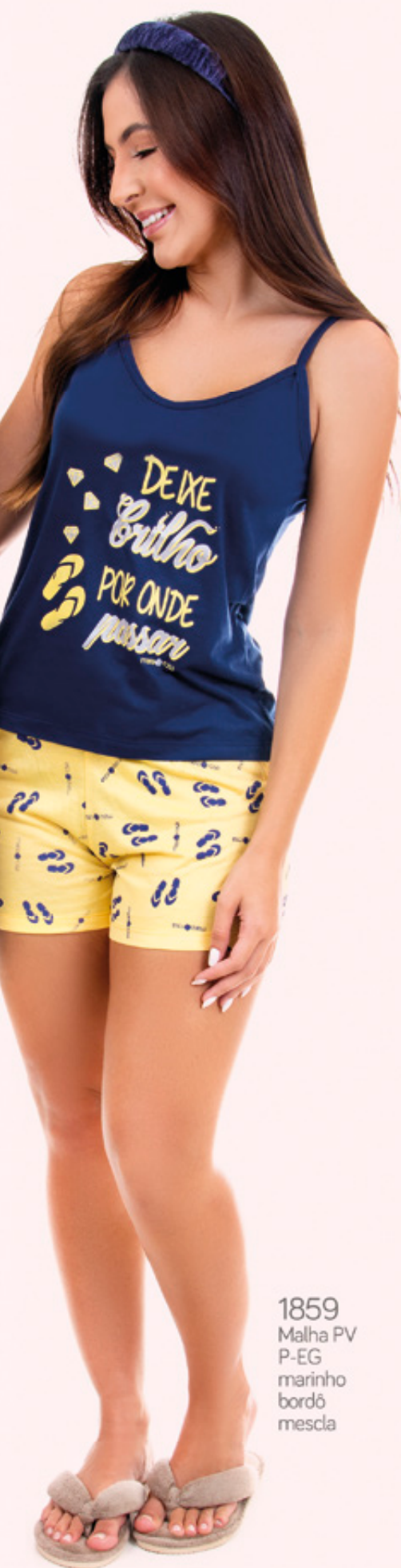
1859 Malha PV P-EG marinho bordô mescla