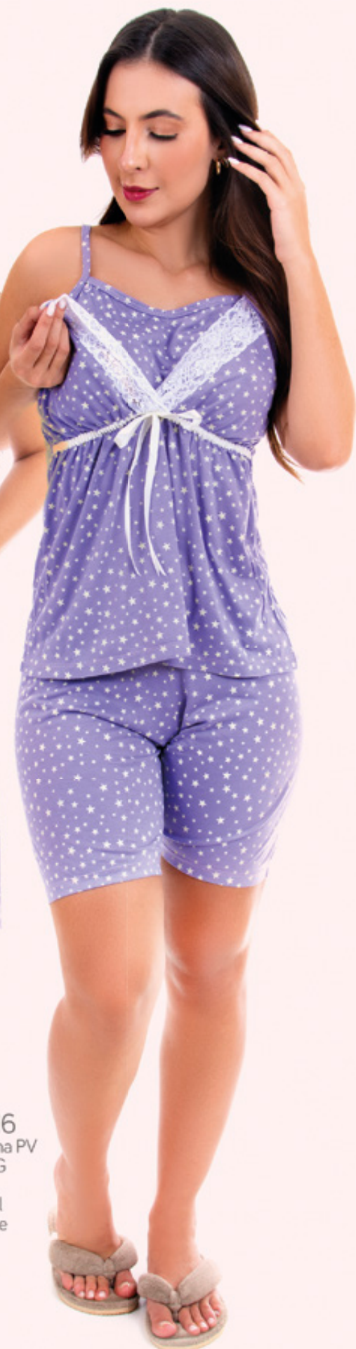
1916 Malha PV P-EG lilás coral verde