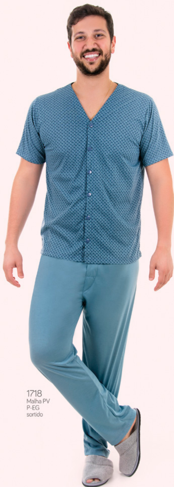
1718 Malha PV P-EG sortido