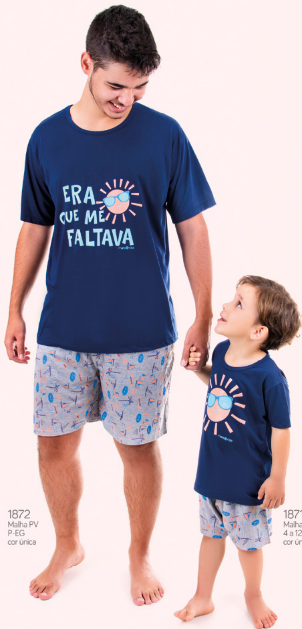
1872 Malha PV P-EG cor única