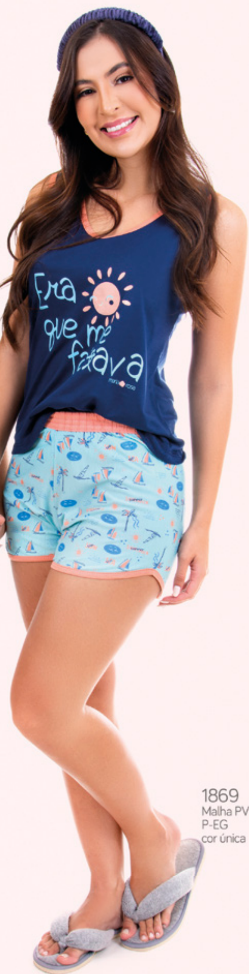
1869 Malha PV P-EG cor única