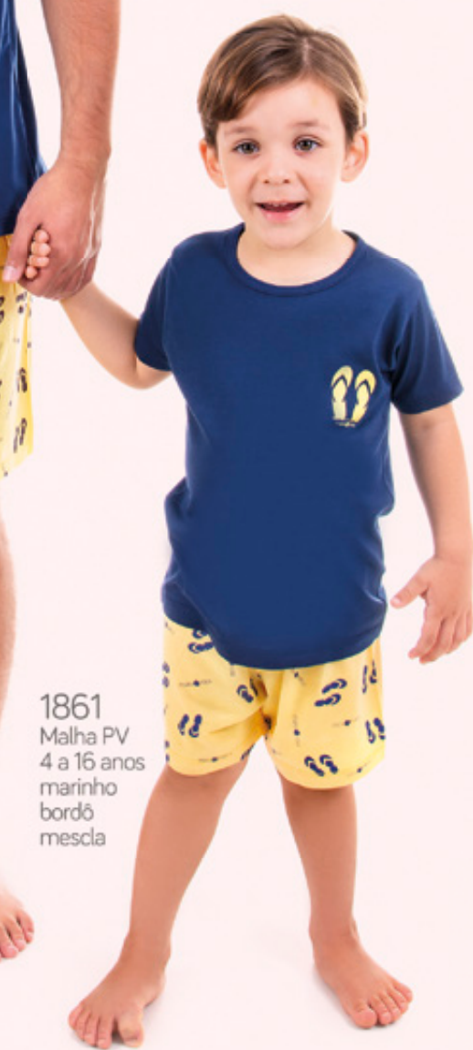
1861 Malha PV 4 a 16 anos marinho bordô mescla