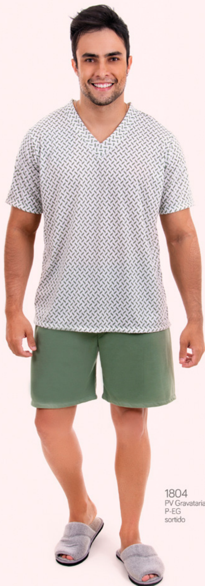
1804 PV Gravataria P-EG sortido