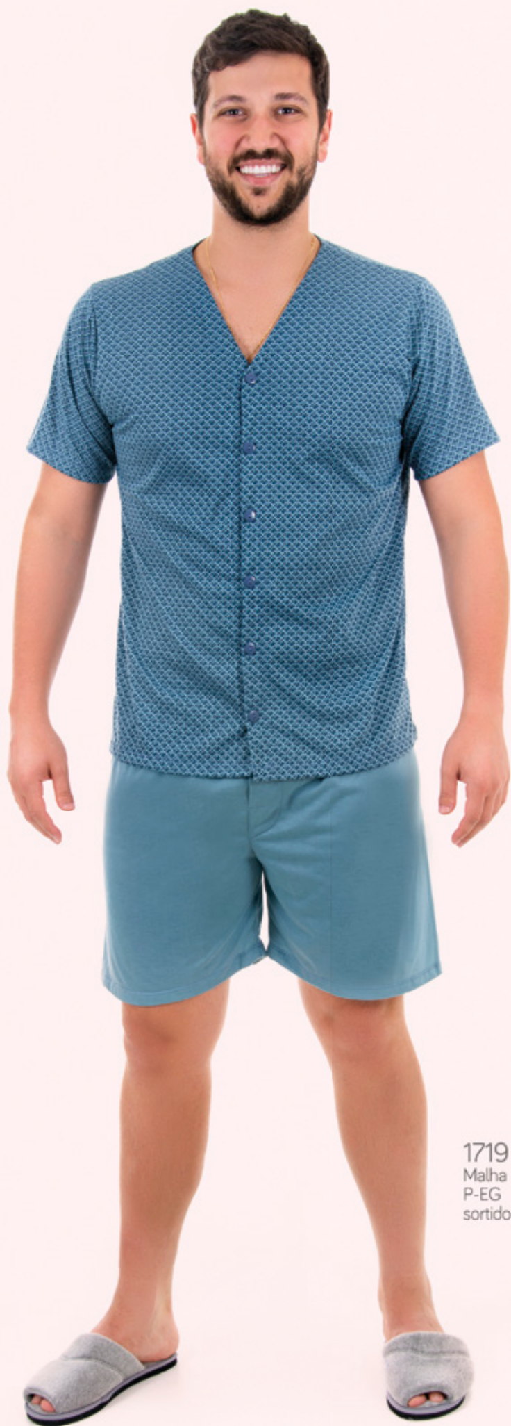
1719 Malha PV P-EG sortido