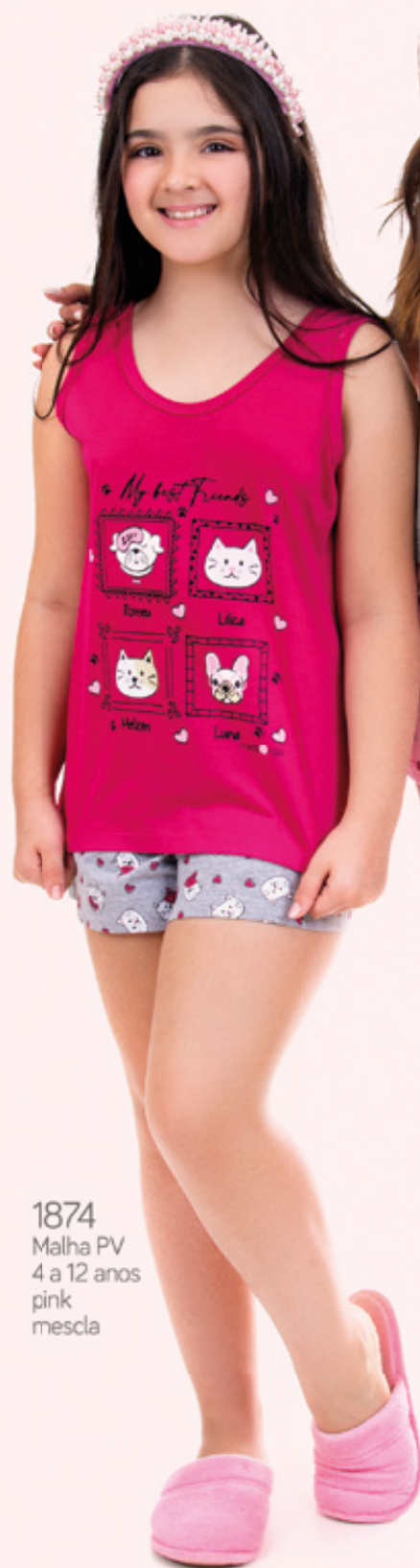
1874 Malha PV 4 a 12 anos pink mescla