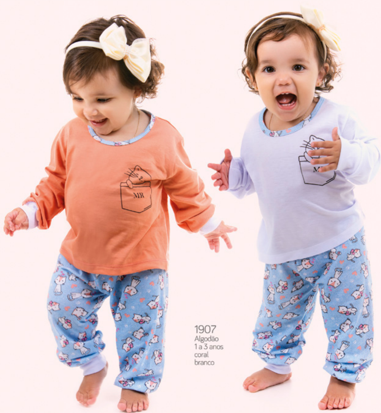
1907 Algodão 1 a 3 anos coral branco